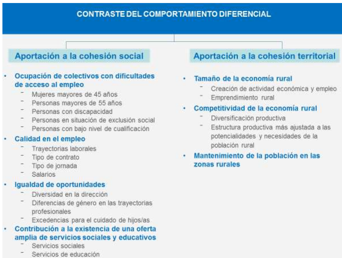
Gráfico 3. Contraste del comportamiento diferencial de las entidades y empresas de economía social en relación a su aportación a la cohesión social y territorial